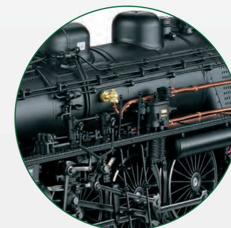
Abbildung zeigt das Modell in Vitrinenstellung mit diversen Ansteckteilen.

On the left side of the locomotive you will find in addition to the copper lines the air compressor, two oil pumps, and the lubrication line distributor.