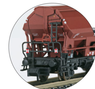
Seitentladewagen mit Zugschluss Scheiben