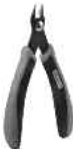
Art. Nr. 170688 Spezial-Seitenschneider

Vloeibare lijm in plastic-flacon met doserbuisje om nauwkeurig te lijmen.