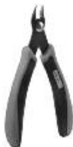
Art. Nr. 170688 Spezial-Seitenschneider zum gratfreien Abtrennen von feinsten Spritzteilen. Nur für Polystyrol geeignet.

Vloeibare lijm in plastic-flacon met doseerbuisje om nauwkeurig te lijmen.